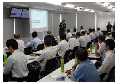
全体説明(コマツ IOT センタ東京)